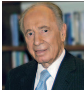
שמעון פרס, נשיא המדינה

השורה התחתונה: הקמת פארק ההיי-טק בבאר שבע ובניית עיר הבה"דים הם הקטר החדש של ההיי-טק, שיוביל את הנגב לצמיחה כלכלית וחברתית, אם רק לא יפריעו לו לדהור.