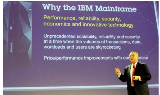
סטיב מילס, סגן נשיא בכיר ומנהל קבוצת התוכנה והשירותים של יבמ, עונה על השאלה מדוע המיינפריים מותאם ביותר, כבר 50 שנה, למיחשוב הארגוני הגלובלי, ומעתה גם לעידן הענן

לתלמידיהם את המשאבים הנדרשים על מנת לפתח כישורים בתחום המיחשוב ולהיחשף לאפשרויות העבודה בתחום. החברה משתפת פעולה עם סטודנטים, מרצים, עסקים ואוניברסיטאות על מנת להציע קורסים ביותר מ-1,000 מוסדות ב-70 מדינות. יבמ מציגה שלושה קורסים מקוונים חדשים, המשותפים לה ולאוניברסיטת סידקוס, קולג' מריסט וקרן לינוקס. הקורסים זמינים ללא תשלום לכל אדם, בכל מקום ובכל עת.