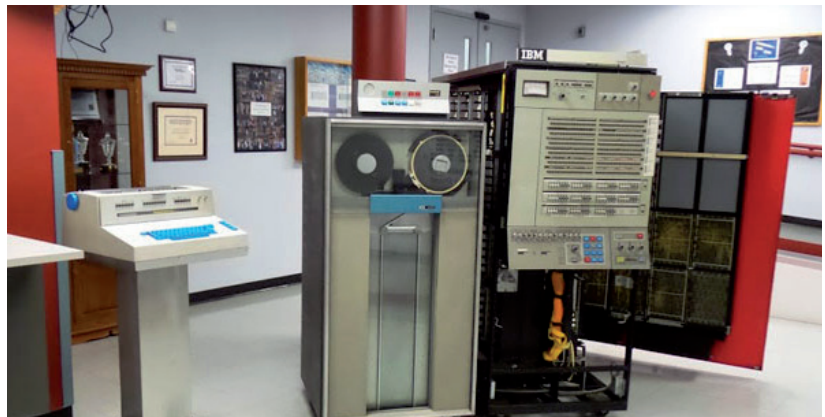
היה היה. מחשב המיינפריים הראשון, ה-360 S