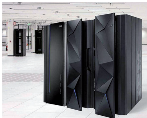
מחשבי המיינפריים של ימינו, ה-System Z, עם דלתות האורגנימי שחוסכות אנרגיה ורעשים

עד היום פועלים מעל 10,000 מחשבי מיינפריים של יבמ, בעיקר במוסדות פיננסיים, ממשלתיים, ביטחוניים, מפעלי תעשייה גדולים וחברות גלובליות.