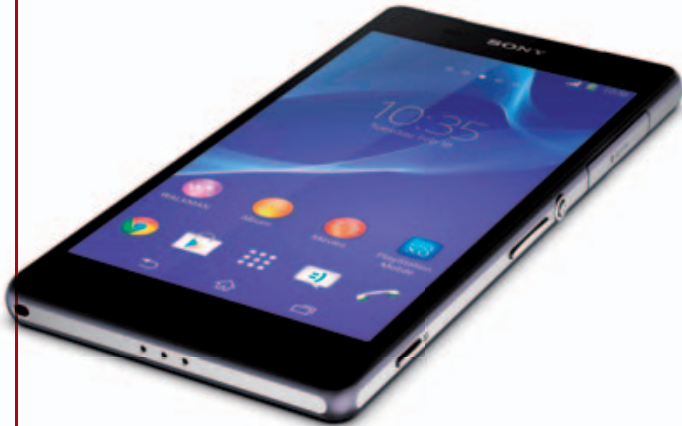
"בעל המצלמה הטובה בעולם" של סוני Xperia Z2

Z של החברה, ותכונותיו הבולטות הן "המצלמה הטובה בעולם", לדברי החברה, מסך איכותי וחסיונות למים. מצלמת המכשיר היא בת 20.7 מגה-פיקסלים, שמצלמת וידיאו באיכות K4, אך למרות המסך האיכותי של המכשיר - Triluminous בגודל 5.2 אינץ' וברזולוציה של Full HD, המתקרב באיכותו למסכי הטלוויזיה של סוני - הוא לא תומך בתצוגת K4. כדי לשפר את חוויית הווידיאו המצולם גם מבחינת הצליל, הוסיפה סוני לחבילה גם מיקרופון סטריאופוני.