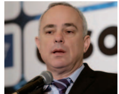
ד"ר יובל שטייניץ