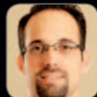
פרופי רן בליצר משרד הרופא הראשי, שירותי בריאות כללית