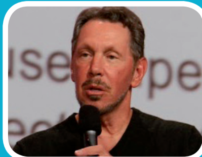
לארי אליסון, מנכ"ל ומייסד אורקל, נכנס לעידן בסיסי הנתונים ב-In-Memory (עמ' 18)