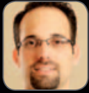
פרופ' רן בליצר משרד הרופא הראשי, שירותי בריאות כללית