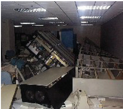
חדר מחשב לאחר רעידת אדמה

מכאן שבלתי נמנע כי על קברניטי המדינה ומנהלי המשק להיערך לא רק לפינוי וטיפול בנפגעים ובחסי קורת גג, אלא גם להבטיח שההתאוששות מהאסון תהיה מהירה. לשם כך יש לטפל בעקב אכילס של החברה המודרנית - הפגיעות הגדולה של האמצעים הטכנולוגיים שאנו תלויים בהם.