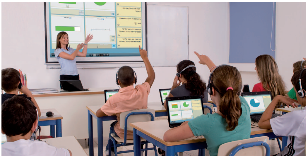
לומדים בכיתה הרגילה עם מחשבים יידיים

התוכנית בחמש שנות פעילותה", אומרים פיינסמר ווייס. כלי נוסף הוא מחולל התוכן CGE, שבו מוטמעת המתודולוגיה הפדגוגית, ויזואלית וייחודית לאותה תוכנית לימוד. הכלי מאפשר למורה כלי עריכה, תכנון מערכי לימוד, צפייה מקדימה של פריטי לימוד, כלי מולטימדיה ועוד. את כל השירותים האלו מספקת עת הדעת לבתי הספר באמצעות תצורת הענן של משרד החינוך בסיוע בזק בינלאומי.