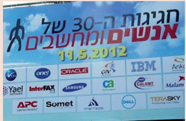
ממ"ר(ם), הקימו במרוצת השנים את התשתית לענף ההיי-טק הישראלי. נכון, המיחשוב בישראל החל קודם לכן, אך אין להקל ראש בתרומתם.