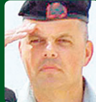
אלוף עוזי מוסקוביץ